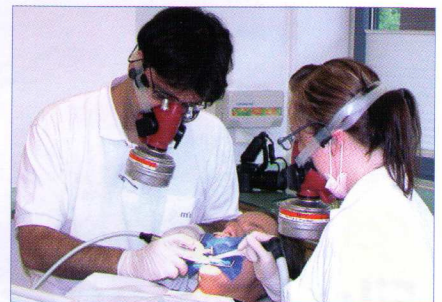
Abb. 2: Amalgamentfernung mit Kofferdam-Folie, „Clean-up“-Sauger, Sauerstoffzuführung für den Patienten sowie Atemschutz für den Behandler und die Assistenz.

Voraussetzung für eine erfolgreiche Entgiftung des Körpers ist die professionelle Entfernung der Hg-Quellen.